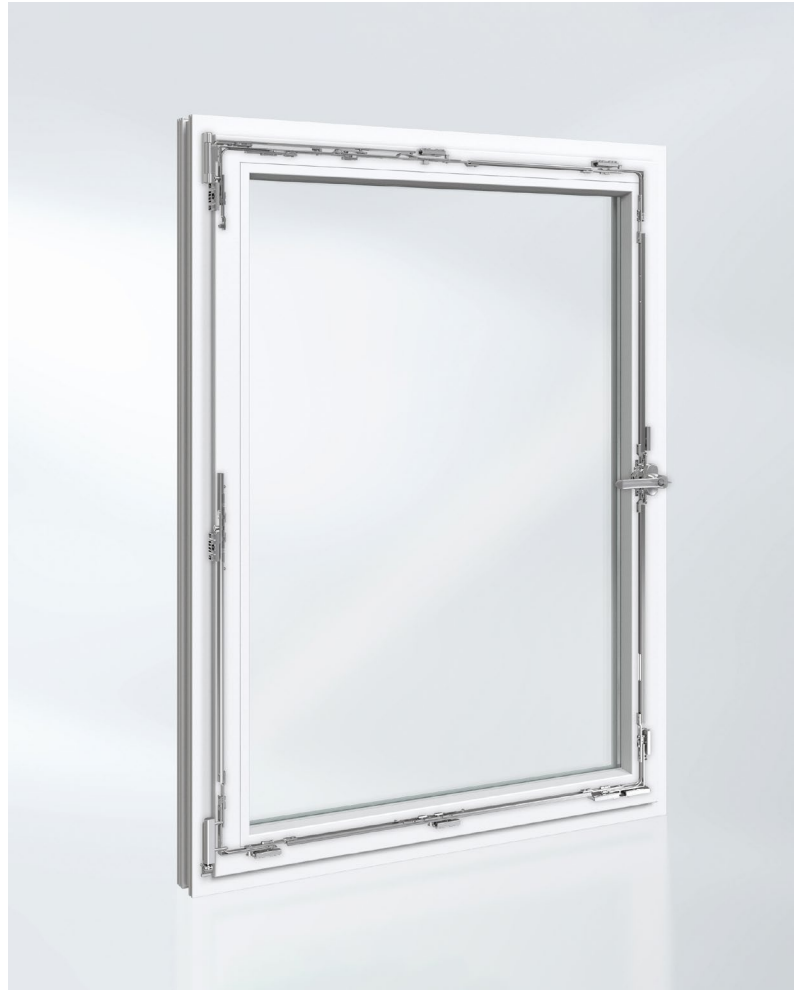
Schüco VarioTec Advanced