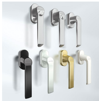
Maniglie linea Standard