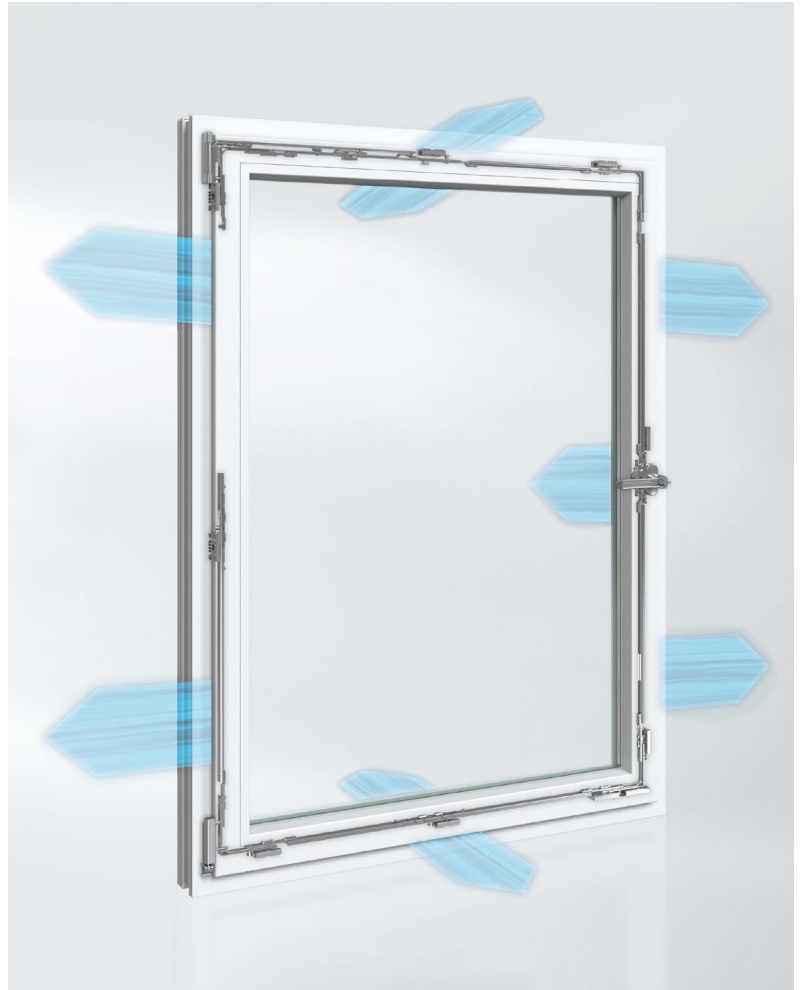
Schüco VarioTec Advanced Air